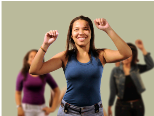
Gravidez para para conseguir se libertar da autoridade dos pais.