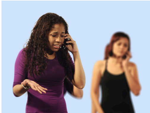
Gravidez para prender namorado.